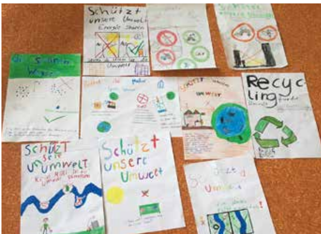
Umweltplakate der SchülerInnen